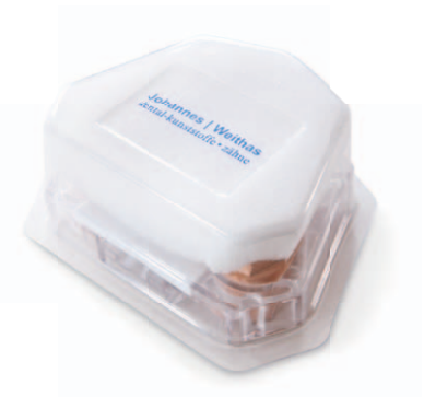
Transparente Krystal Tray Versandbox mit Laborlogo

Das Krystal Tray Modell System unterstützt Sie bei der hochwertigen Präsentation der zahntechnischen Arbeit bei Ihren Kunden. Der Patientennamen lässt sich optimal auf der Außenseite des Trays anbringen. Für den anschließenden Versand der Trays erhalten Sie die genau passenden Krystal Safe Versandboxen. So ist Dank der transparenten Versandbox der Patientennamen auch ohne zu öffnen perfekt von außen lesbar. Optional bieten wir Ihnen an, die weißen Arbeitszungen und Versandboxen mit Ihrem Labor- bzw. Praxislogo zu personalisieren.