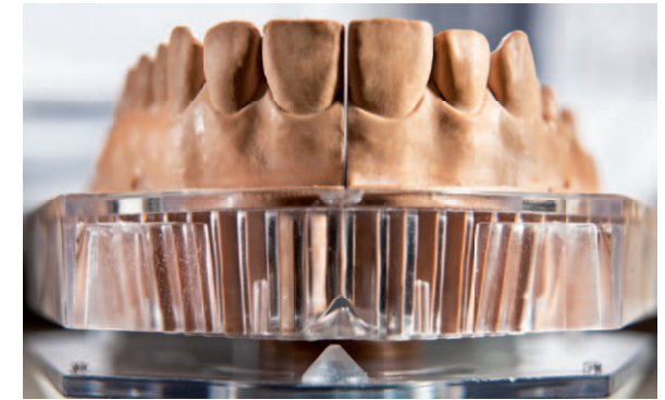
Konische Lagerung zwischen Tray und Artikulationsplatte