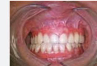
Valplast-Teilprothesen im Ober- und Unterkiefer