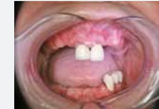
Inhomogene Struktur des Alveolarkamms