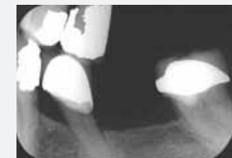
1997, nach 7-jährigem Tragen