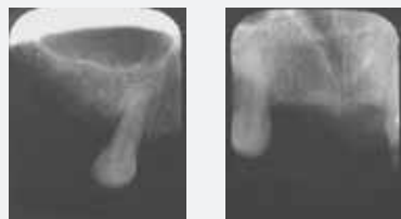
1997, nach 5-jährigem Tragen