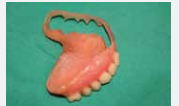
Prothese nach 1 Jahr