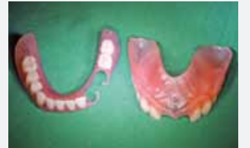
Valplast-Prothesen mit weichbleibender Unterfütterung