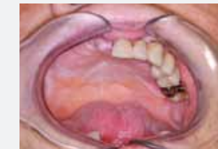
Fehlender Alveolarkamm, nur muköse Defektdeckung