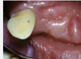
Kontrolle im Jahr 1997 zeigt gesundes Zahnfleisch