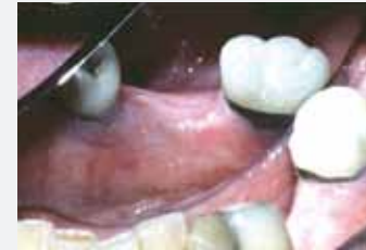
Hervorragend gesundes Zahnfleisch