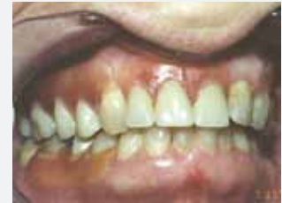
Komfortable und ästhetische Klammern der Valplast-Teilprothesen