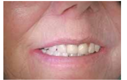
Maxilläre und mandibuläre Valplast-Teilprothese