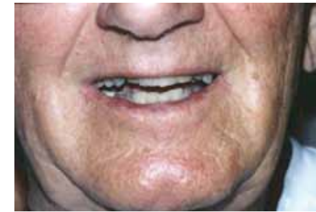
Valplast-Teilprothese, eingesetzt 1990