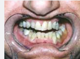
Valplast-Teilprothese im Unterkiefer