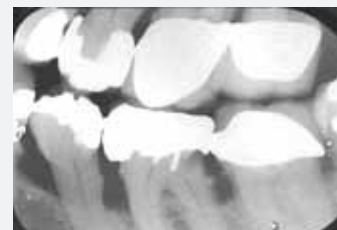
1989, kurz vor Extraktion