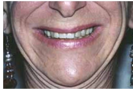
Valplast-Ober- und Unterkiefer-Teilprothese