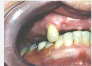
Valplast-Teilprothese, eingesetzt 1992